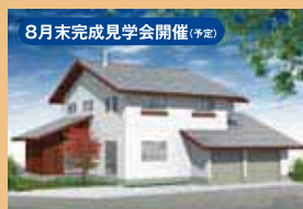
8月末完成見学会開催(予定)

その他上越市稲田地区と柿崎区に建築途中の現場がございます。ご希望のお客様はお知らせください。ご案内いたします。